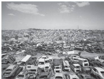
Figura 3. Cemitério de Automóveis em São Paulo

Essa oportunidade possibilitaria uma prática do design para além do processo devastador e do espetáculo público de banalização da palavra, no sentido de “uma nova conceituação e uma ética do desenho industrial no Brasil”, como propugnou Aloísio Magalhães. São muitas as possibilidades, porém todas elas requerem uma reavaliação de alguns aspectos do design.